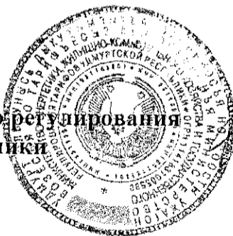
И. В. Маринин

Министр энергетики, жилищно-коммунального хозяйства и государственного регулирования тарифов Удмуртской Республики